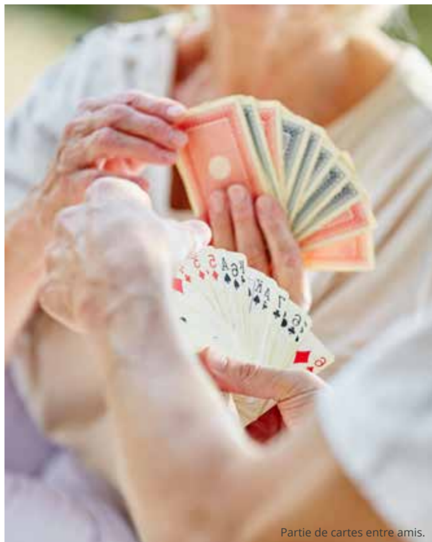
Partie de cartes entre amis.

Spécifiquement formés en interne de façon régulière, les régisseurs sont les garants du concept Les Villages d'Or.