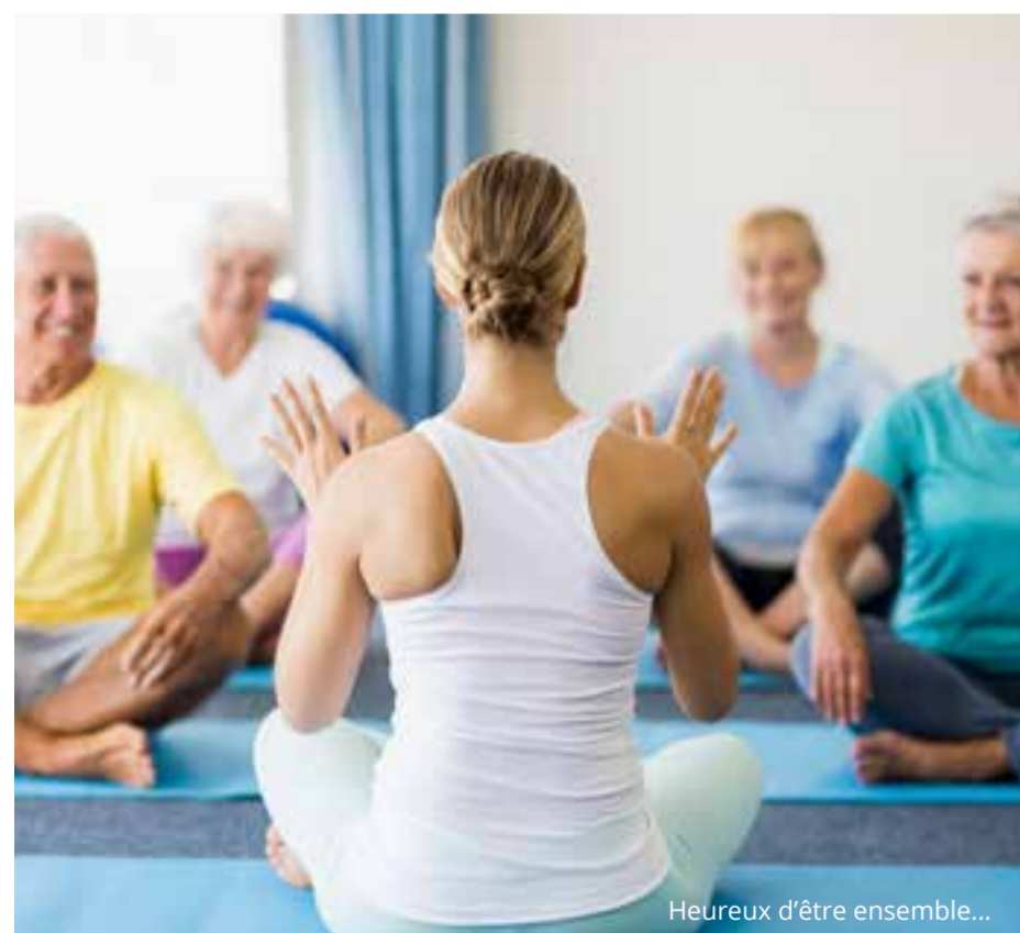
Heureux d'être ensemble...