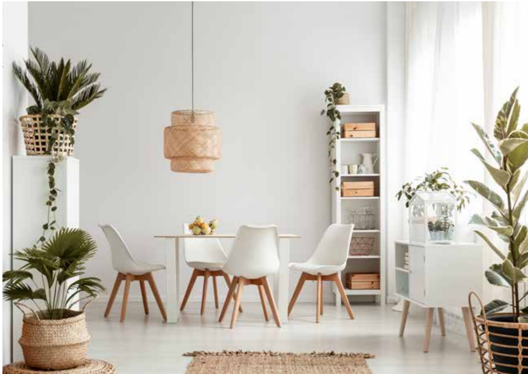
Des intérieurs agréables à vivre et ouverts sur la nature environnante.